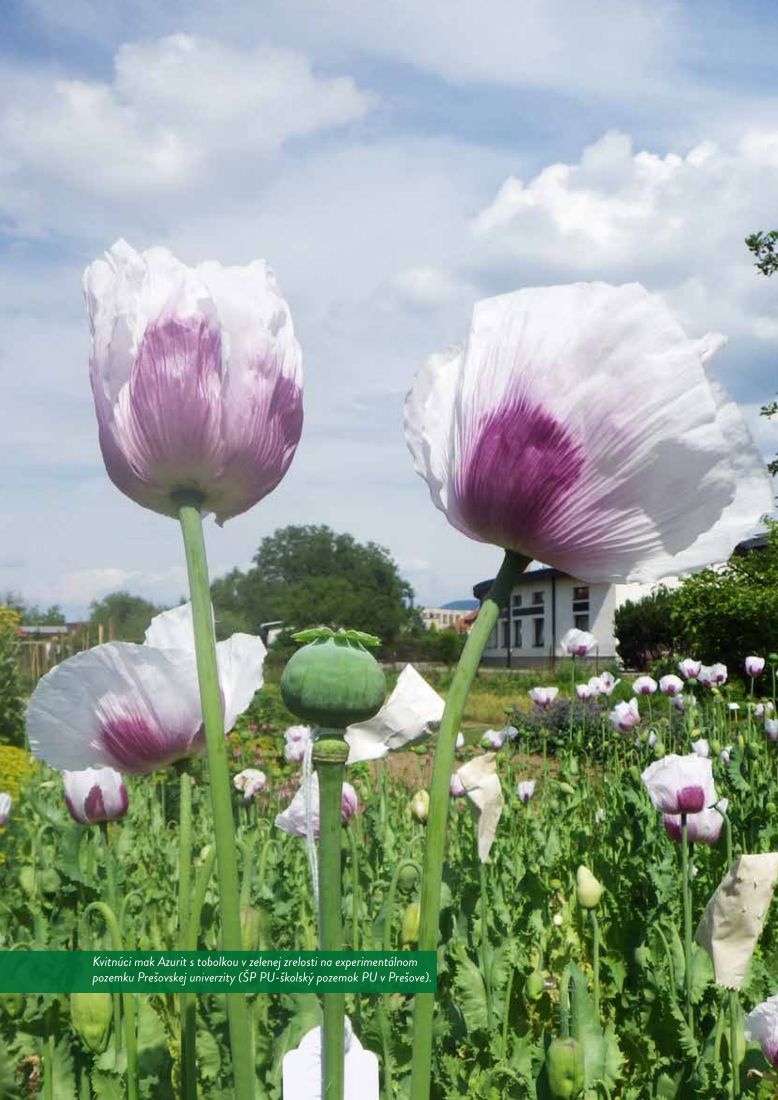
Kvitnúci mak Azurit s toboľkou v zelenej zrelosti na experimentálnom pozemku Prešovskej univerzity (ŠP PU-školský pozemok PU v Prešove).