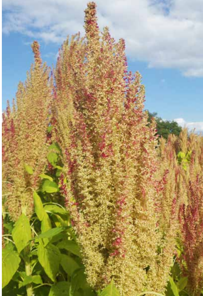
Súkvetie lásavca odrody Pribina vo fáze dozrievania (ŠP PU).

gii pri CVTI SR. Tieto dokumenty sú podkladom k tomu, aby si univerzita ako zamestnávateľ mohla písomne uplatniť voči pôvodcovi právo na riešenie, a to v lehote 3 mesiacov od doručenia oznámenia. Za uplatnenie práva na riešenie sa považuje aj podanie prihlášky.