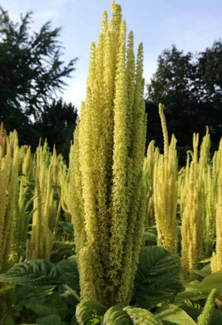
Súkvetie láskavca odrody Zobor v čase dozrievania (ŠP PU).