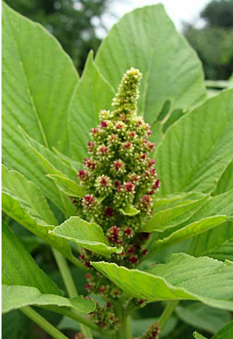
Súkvetie lásavca odrody Pribina, fáza tvorba súkvetí (ŠP PU).