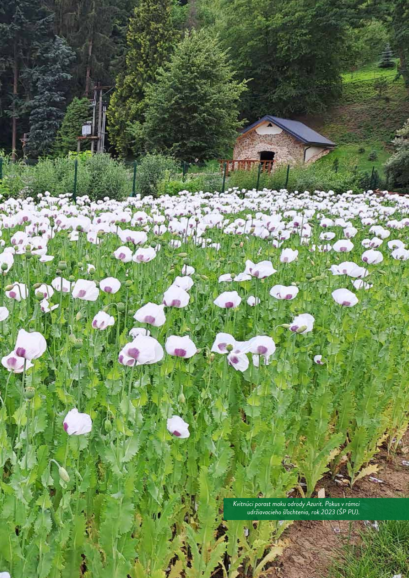
Kvitnúci porast maku odrody Azurit. Pokus v rámci udržiaavacieho šľachtenia, rok 2023 (ŠP PU).