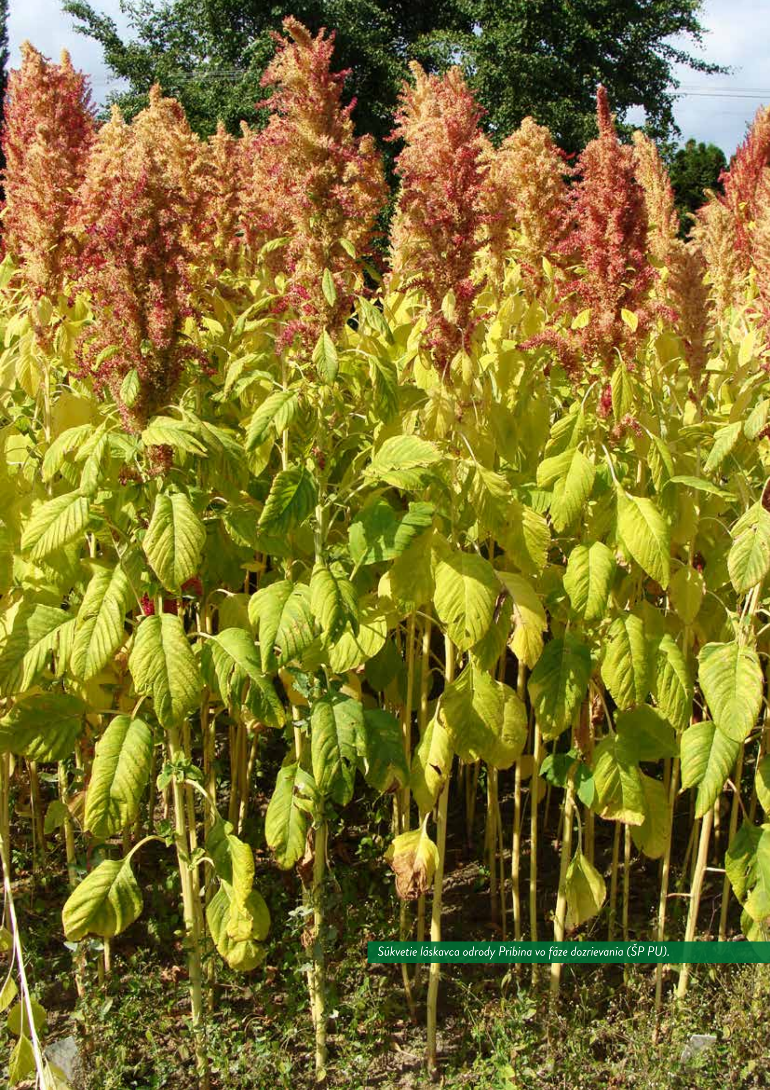
Súkvetic laskavca odrody Pribina vo fáze dozrievania (ŠP PU).