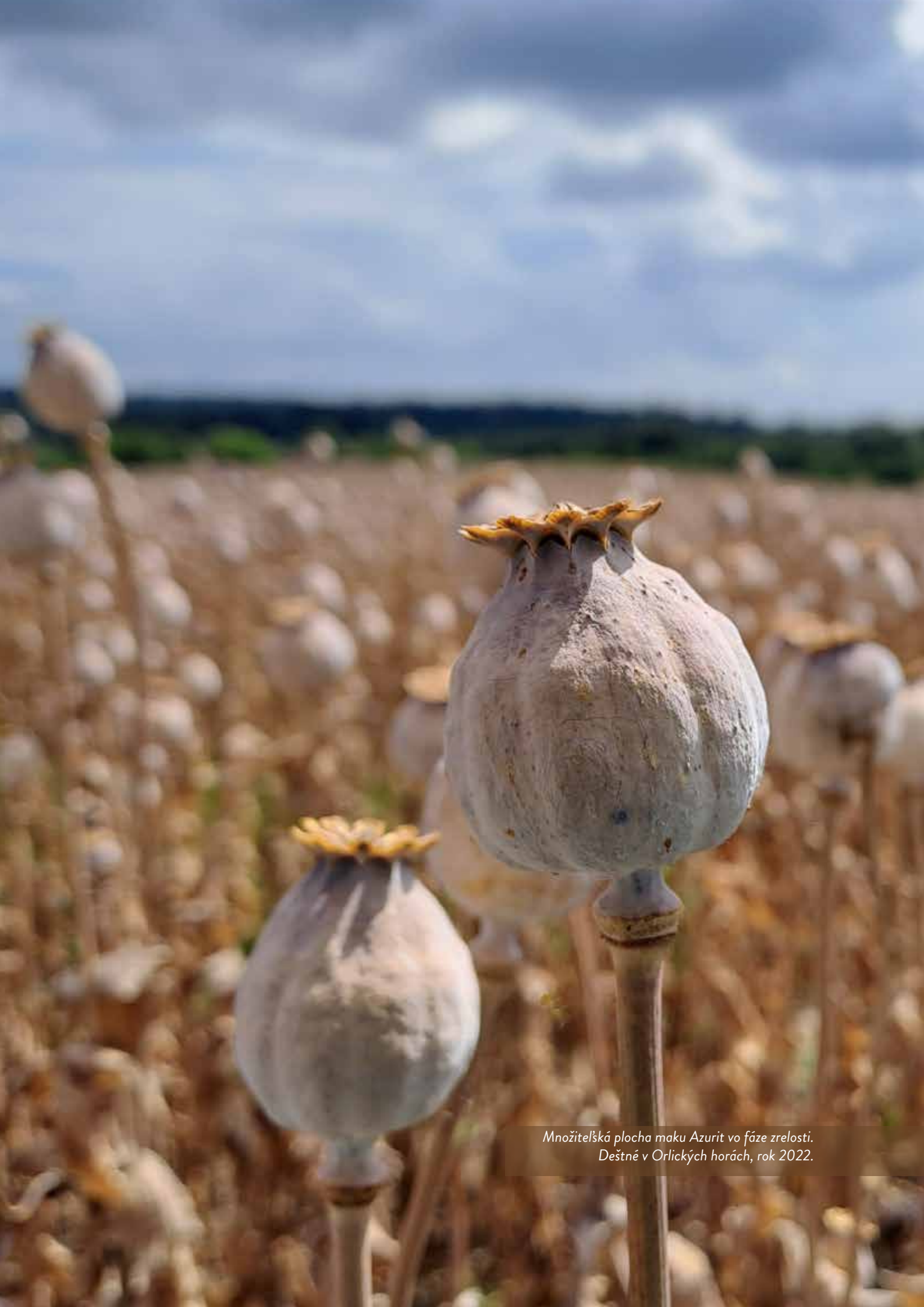
Množitelská plocha maku Azurit vo fáze zrelosti. Deštné v Orlických horách, rok 2022.