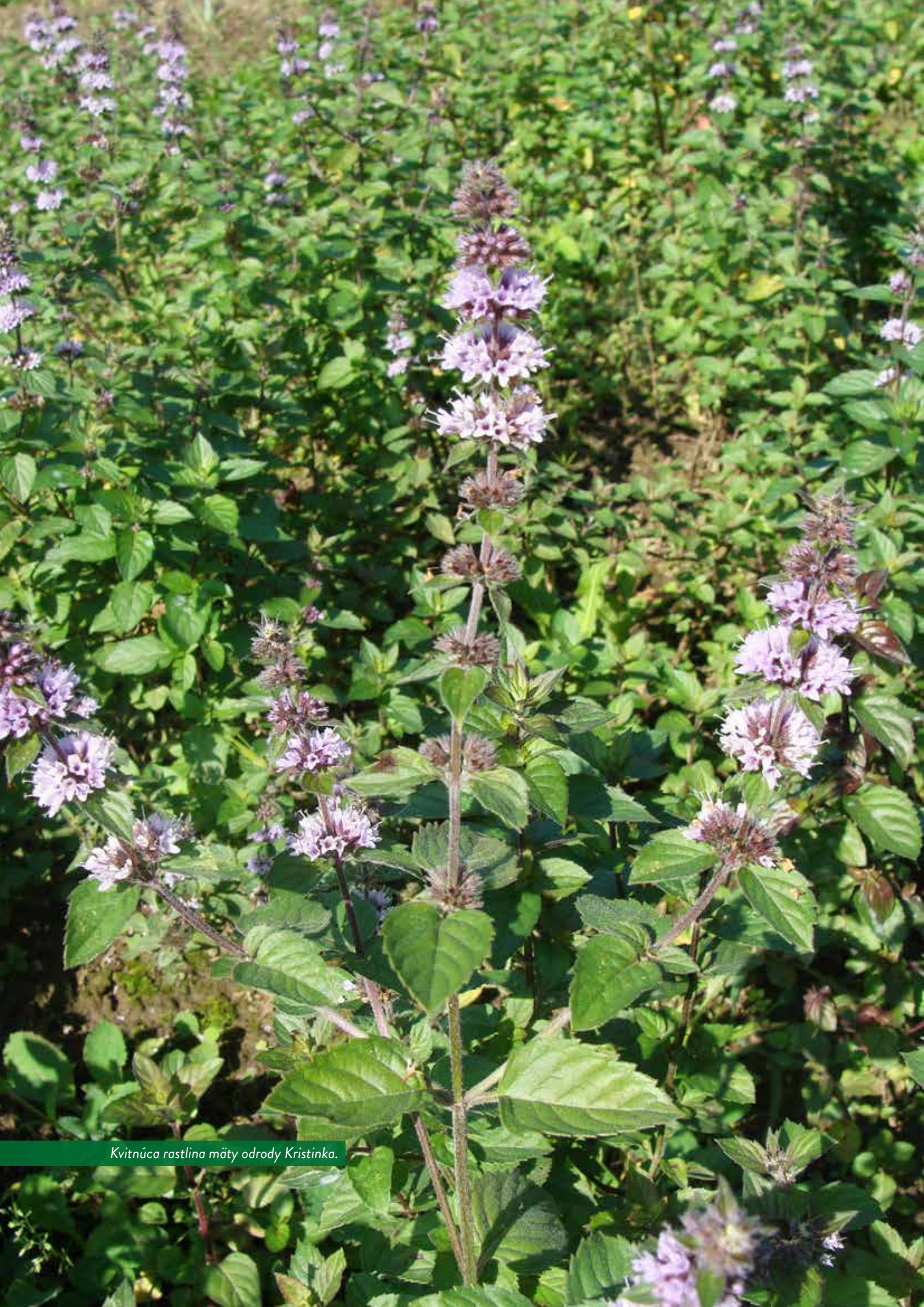
Kvitnúca rastlina mäty odrody Kristinka.